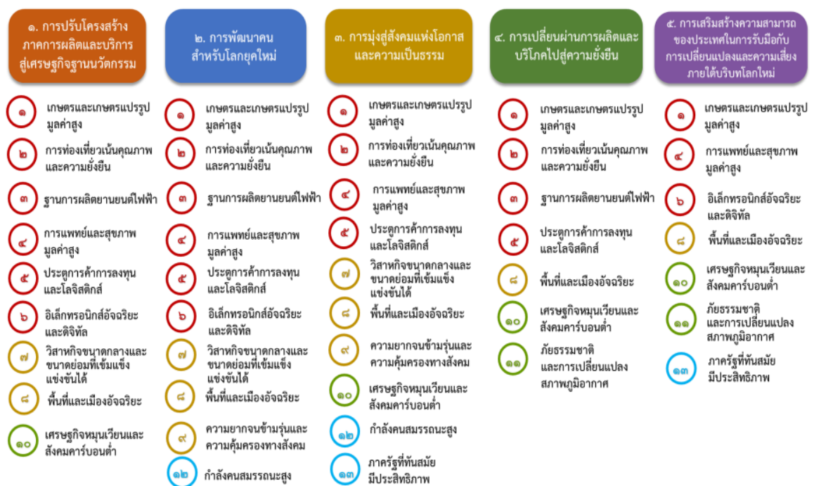
แผนภาพที่ ๓.๑ ความเชื่อมโยงระหว่างหมวดหมู่การพัฒนาที่เป้าหมายหลัก

ความเชื่อมโยงระหว่างหมวดหมู่การพัฒนาที่เป้าหมายหลักแสดงไว้ในแผนภาพที่ ๓.๑ โดยหมวดหมู่การพัฒนาที่กำหนดขึ้นเป็นประเด็นที่มีลักษณะเชิงบูรณาการที่ครอบคลุมการพัฒนาตั้งแต่ในระดับต้นน้ำจนถึงปลายน้ำ และสามารถนำไปสู่ผลพัฒนาทั้งในมิติเศรษฐกิจ สังคม ทรัพยากรธรรมชาติและสิ่งแวดล้อมไปพร้อมๆ กัน ทำให้หมวดหมู่แต่ละประการสามารถสนับสนุนเป้าหมายหลักได้มากกว่าหนึ่งข้อ นอกจากนี้การพัฒนาภายใต้แต่ละหมวดหมู่ไม่ได้แยกขาดจากกัน แต่มีการสนับสนุนหรือเอื้อประโยชน์ซึ่งกันและกัน